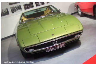
La collection Maserati

Expositions thématiques : les belles carrosseries, les voitures à pédales, le sport automobile, les courses sur lac salé