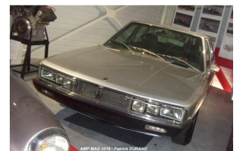
La collection Maserati

MEDIA / COMMUNICATION MAGAZINE YOUNGTIMERS, MAGAZINE GAZOLINE RADIO NOSTALGIE NANTES 96.8 ANDEGAVE COMMUNICATION RETROCALAGE.COM NEWS D'ANCIENNES, AMP MAG